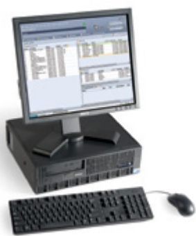
Xerox® FreeFlow® Print Server

Ogni server è progettato per soddisfare un insieme specifico di requisiti di flusso di lavoro e applicazioni. Il rappresentante Xerox è a disposizione per aiutarvi a scegliere quello che meglio si adatta alle vostre esigenze.