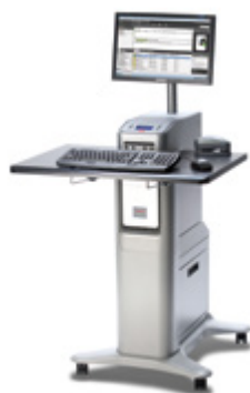
Xerox® EX Print Server, basato su tecnologia Fiery®*