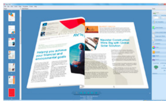
Xerox® Integrated Fiery® Colour Server