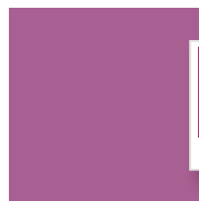
Callout colore spot