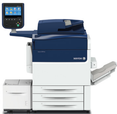
Stampante Xerox Versant 80